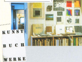
räume.spaces ラウム・スペース

国内外で発行された、多彩なデザインや装丁のアーティストブックやカタログ、ポスターなどの印刷物を展示販売。